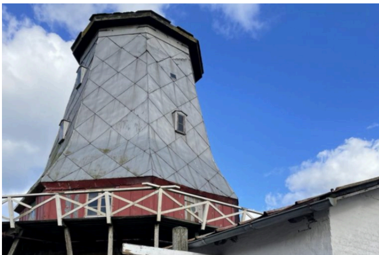
Elstrup Mølle. Pressefoto